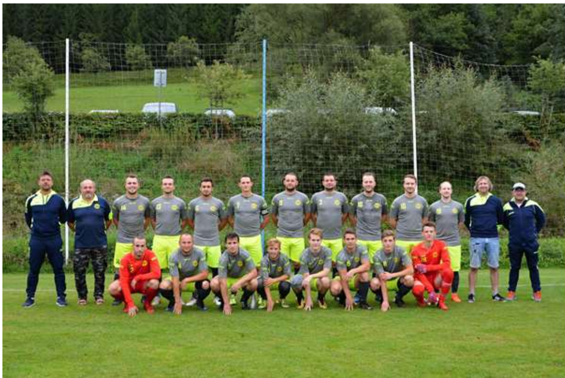
Muži TJ Sokol Kateřinice