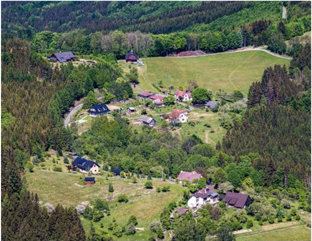
Paseky pod Ojíčnú