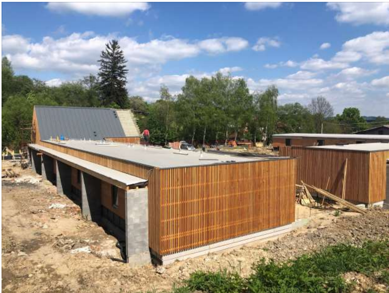
Výstavba Domu Kateřinka v areálu bývalého ZD