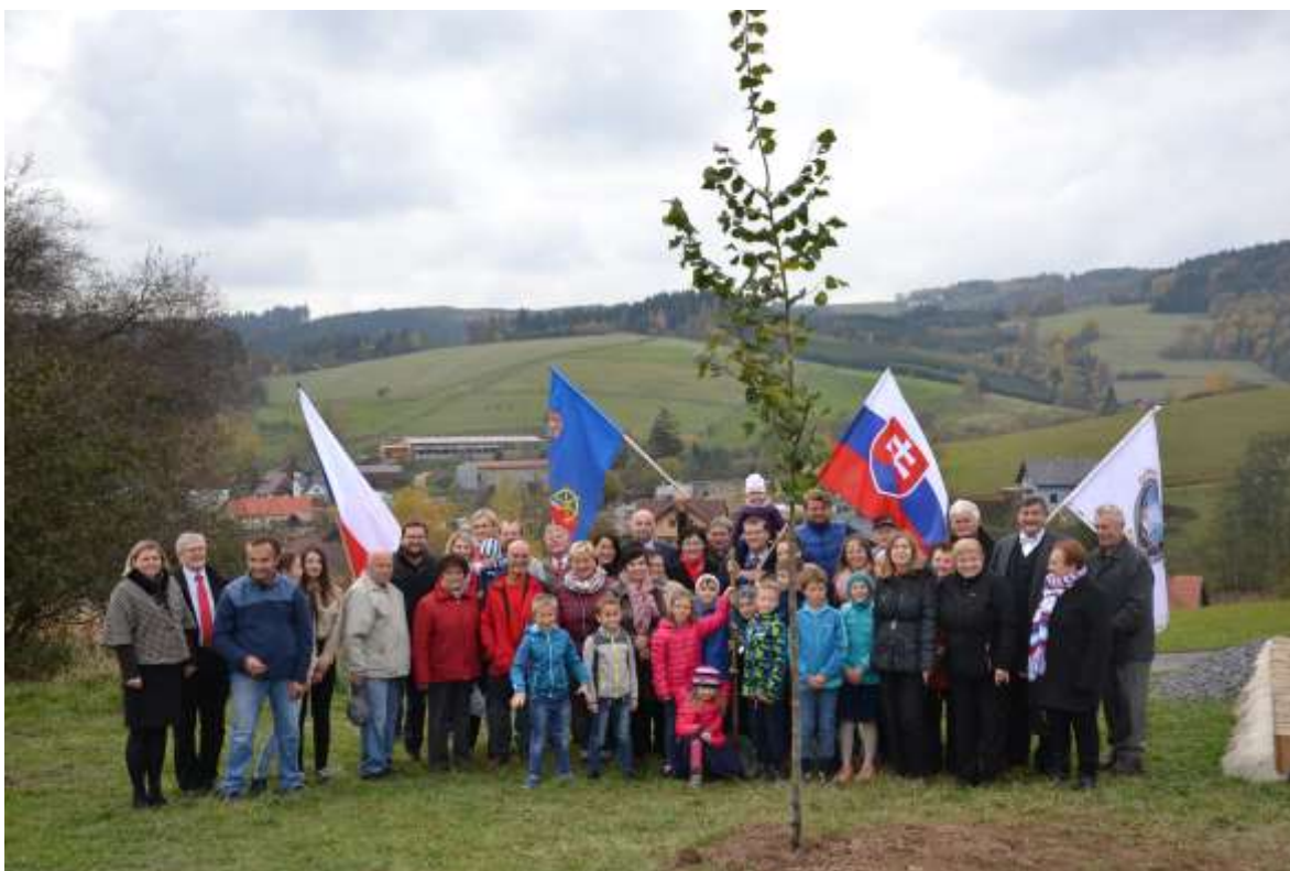
Zasazení lípy svobody u příležitosti 100 let od vzniku samostatného Československa