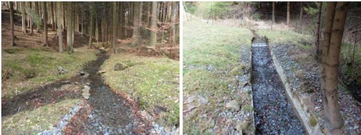
Foto jímacích zářezů surové vody na potocích při běžném průtoku

Obec je zásobována pitnou vodou z povrchových zdrojů – jímání vody z přítoků potoku Kateřinky v lokalitách Pod Vrtaným a U Kolena a z podzemních zdrojů pomocí vrtaných studní ve stejných lokalitách. Zdroje surové vody jsou dopraveny do vodárny, kde projdou úpravnou vody a dále do vodojemu s napojením na obecní vodovod. Zdroje povrchové vody z potoků v období bez vydatných srážek nedostačují, již od jara do podzimu potoky vysychají a vodárna musí být doplňována čerpáním vody z vrtaných studní.