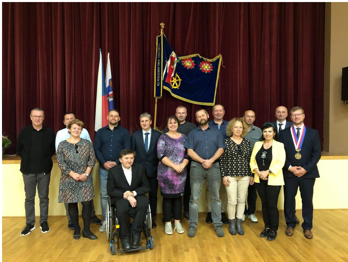
NOVĚ ZVOLENÉ ZASTUPITELSTVO OBCE