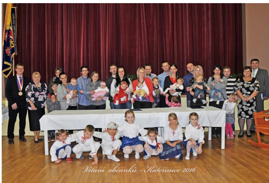
Vítání občánků - Kateřinice 2016