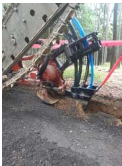
Vibrační pluh s připojenou frézou pro skalnaté podloží a detail z pokládky médií

Akci velkého rozsahu v příštím roce, která se dotkne všech občanů připojených na obecní vodovod, je výměna stávajících vodoměrů. Po dlouhých diskuzích byl zvolen koncept ultrazvukového měření pitné vody s dálkovým odečtem a akustickou detekcí úniku vody na přípojce. Tento moderní koncept nahrazuje dříve zvažované úsekové měření a umožní nám zejména tyto věci: