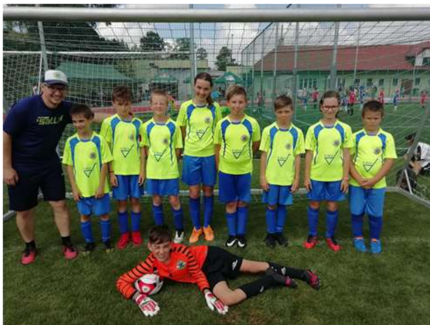
Starší přípravka TJ Sokol Kateřinice